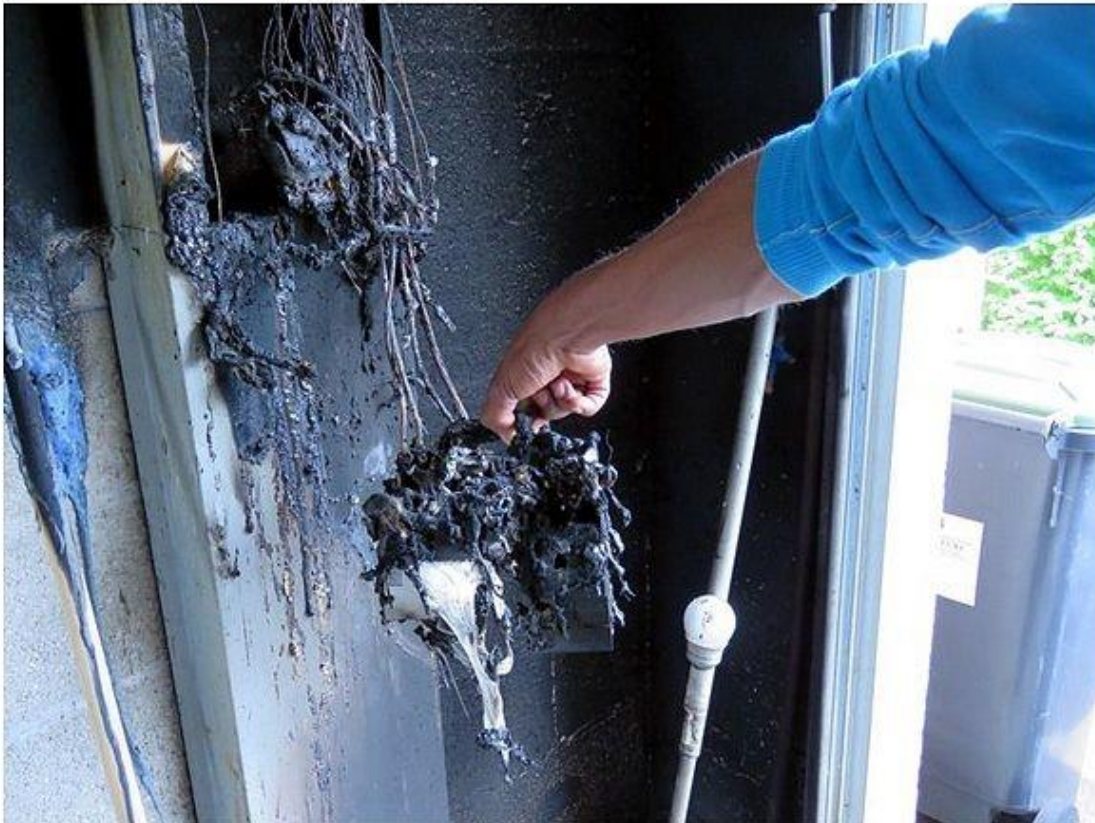
Le compteur Linky a complètement fondu.

« C'est une histoire qui va être très longue », prédit Fabien (1) . Le passage des experts n'est pas complètement terminé quand La Dépêche de Louviers le contacte. Les traits fatigués, l'homme garde le sourire malgré l'incendie du vendredi 18 mai . Il ouvre la porte du pavillon de plain pied qu'il loue à la Siloge . Une odeur âcre de fumée persiste. À l'intérieur, la sule se localise au niveau des fils électriques ou des lampes . Ceci mis à part, presque rien n'est dégradé.