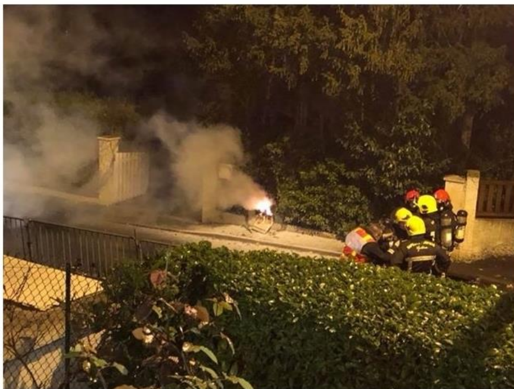
Rue Paul-Doumer, lundi soir à Louveciennes, les pompiers sont intervenus suite à l'incendie d'un compteur Linky.

Les détracteurs du compteur Linky y voient une confirmation de leurs craintes. Lundi soir, rue Paul-Doumer à Louveciennes (Yvelines) , un compteur Linky a pris feu. Les pompiers sont rapidement intervenus, permettant de contenir l'incendie qui n'a provoqué que peu de dégâts.