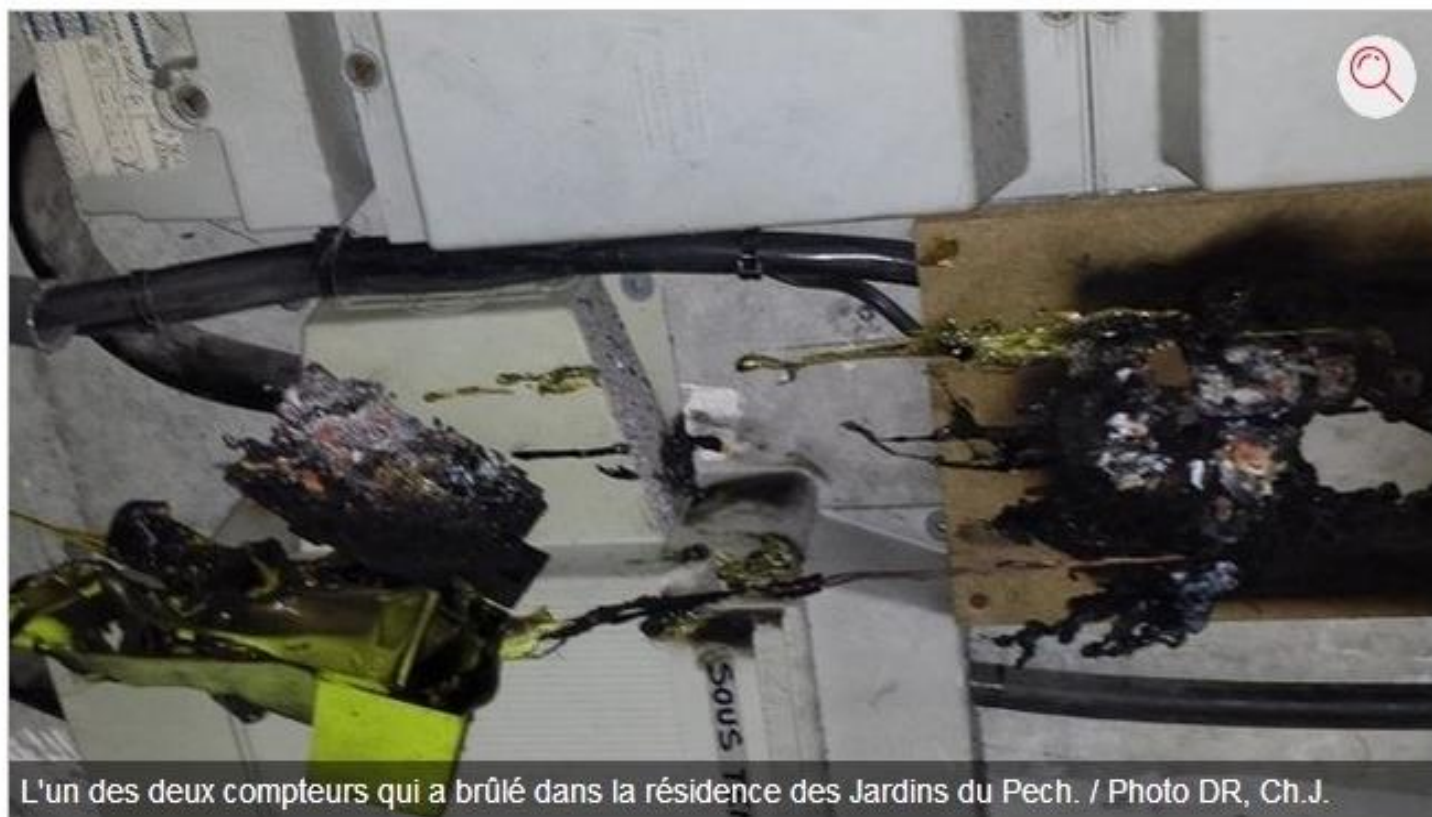
L'un des deux compteurs qui a brûlé dans la résidence des Jardins du Pech.