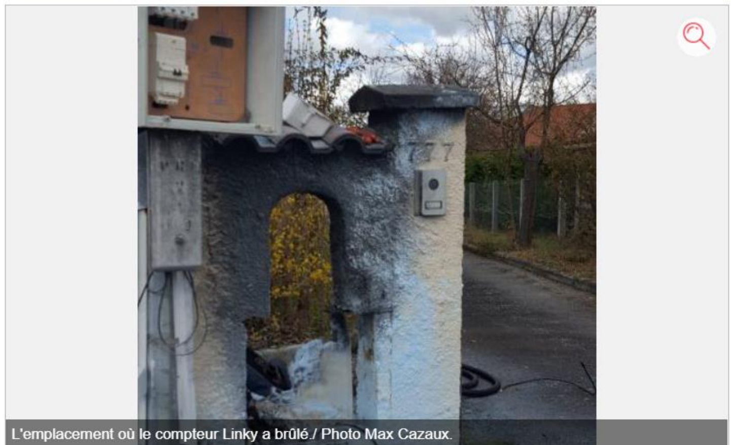
L'emplacement où le compteur Linky a brûlé / Photo Max Cazaux.