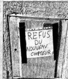
De nombreux riverains ont affiché ce petit mot. Ça peut marcher, ou non...