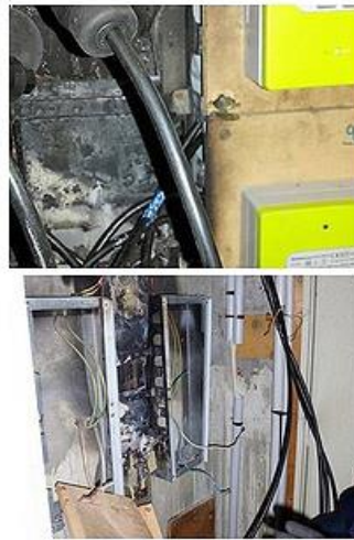
photo Linky dans une cage d'escalier à la Pierre Heuzé à Caen

Tout le hameau de Couteron (un hameau de la commune d'Aix-en-Provence) aura été privé de courant une partie de la nuit avant d'être remis au petit matin, après la section du câble d'alimentation de la maison par Enedis EDF.