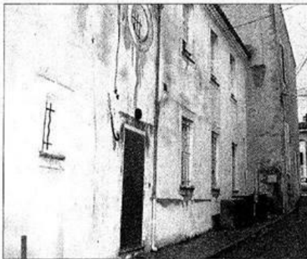
La maison qui a brûlé dans la nuit de mardi à mercredi de la semaine dernière, à Châteauneuf.