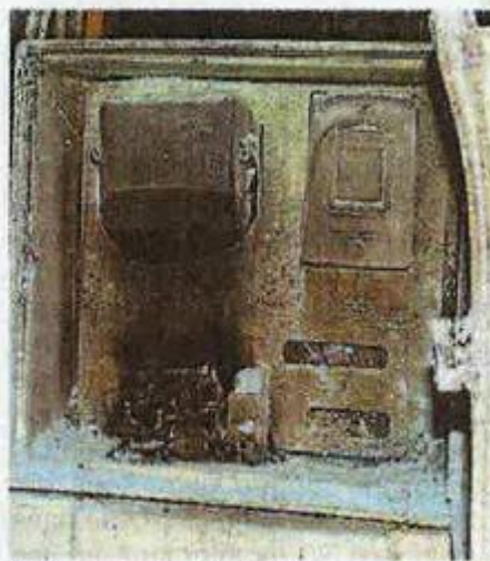
Le compteur détruit.

Dans ce contexte, la destruction d'un compteur Linky dans l'allée Feunteun Sané ne, constatée mardi vers 18 h 30, ne va pas faire diminuer la polémique. Avant l'arrivée des pompiers, l'intervention d'un voisin a limité les dégâts de l'explosion mais le portail a été endommagé. L'inquiétude monte chez des riverains qui